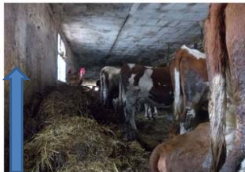
Hauteur tas de fumier